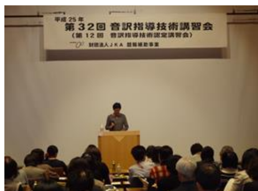
音訳指導技術講習会の様子