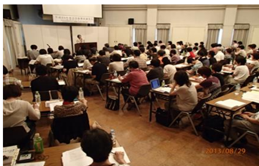
点字指導員講習会の様子

平成25年8月28日～30日まで、山西記念福社会館にて、点字指導員講習会を開催した。