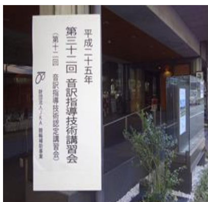
音訳指導技術講習会会場前立て看板

平成25年11月20日～22日まで、玉水記念会館において、音訳指導技術講習会を開催した。