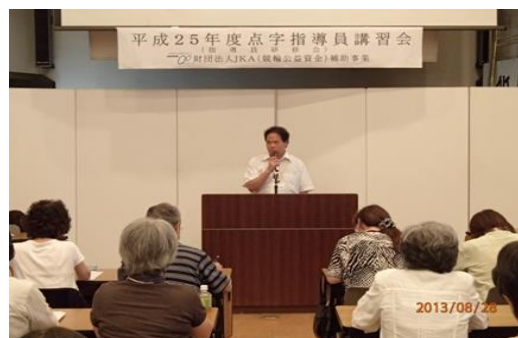
点字指導員講習会開講式の様子